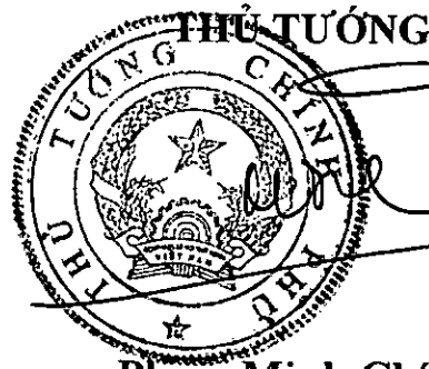
Phạm Minh Chính